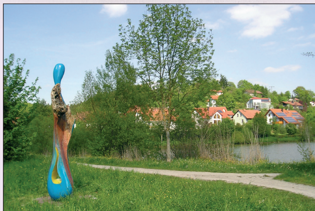
„Eichentropfen“ am Ufer des schön gelegenen Landschaftssees, der dem Oasenweg angegliedert ist.

Allen Förderern des Weges und der Stationen sei herzlich gedankt.