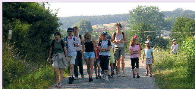
Freizeitgestaltung auf dem Oasenweg